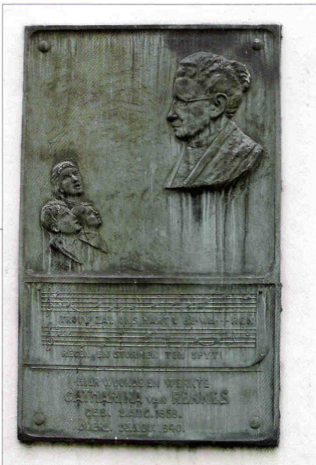
Plaquette op de gevel van Brigittenstraat 1.